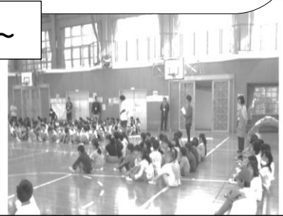
全校のみんなが1年生を温 かく迎えました。