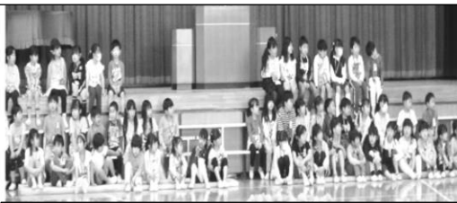
1年生はひな壇に座って全校の みんなとの顔合わせです。