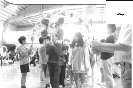
6年生と手をつなぎ お花のアーチをくぐって入場です。