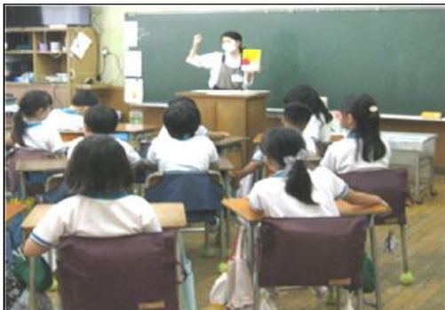
3年 「ブックトーク」 所沢市立図書館柳瀬分館の 方々が来校さ れました。