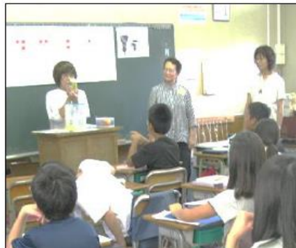
4年 「点字体験」 点訳グループ 「花みずき」 の方々に点字 を教えて頂き ました。