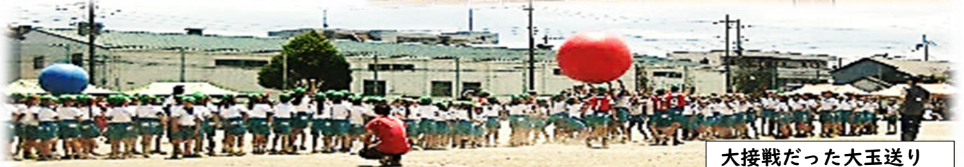
大接戦だった大玉送り